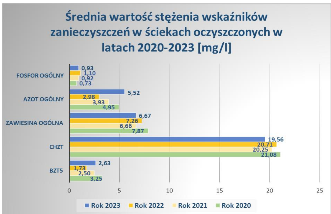
Wykres 1. Średnie wartości wskaźników zanieczyszczeń ścieków oczyszczonych w latach 2020 – 2023

Średnie wartości wskaźników podstawowych zanieczyszczeń ścieków oczyszczonych w 2023 roku na tle poprzednich lat zilustrowano na wykresie nr 1.